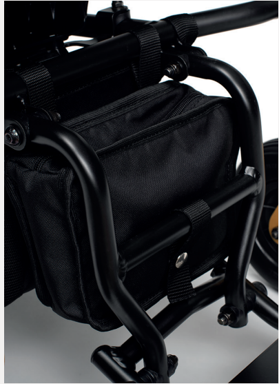
B63 TORBA DO PRZECHOWYWANIA ZA PODNÓŻEK