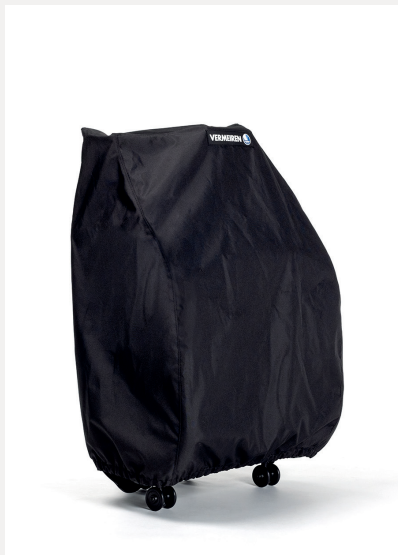
ESE45 POKROWIEC DO PRZECHOWYWANIA