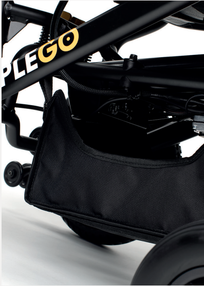
B64 TORBA DO PRZECHOWYWANIA POD SIĘDZENIE