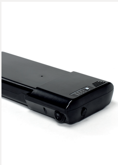
DODATKOWA BATERIA 12,8 AH LUB 17,5 AH

Aby zaspokoić wszelkiego rodzaju preferencje i potrzeby oferujemy szeroką gamę opcji dla Plego. Dodaj dodatkowe funkcje, które odpowiadają Tobie i Twoim potrzebom.